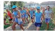
IN POSTO. I podisti durante la partenza edizione del Trofeo Grande Giò

DOMANI con partenza alle 16,30 del campo sportivo comunale di Cascina in via Fosso Vecchio, 2° Trofeo Grande Giò, manifestazione podistica valida per i trofei della "Tre Provincie" e per quello piano provinciale di podismo. Sono previsti 3 differenti percorsi (2, 5 e 10 km), prevalentemente a passo libero ed aperto a tutti, famiglie, ragazzi ed anziani. Per ogni bambino partecipante esiste