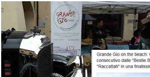
Grande Gio on the beach: Gara dei Castelli vinta per il terzo anno consecutivo dalle "Bestie Bache" e Torneo Beach Volley conquistato dai "Raccattati" in una finalissima di alto tasso tecnico contro i "Beduini"!!